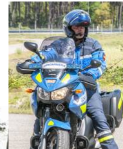
EDSR - Groupement de Gendarmerie Départementale des Landes